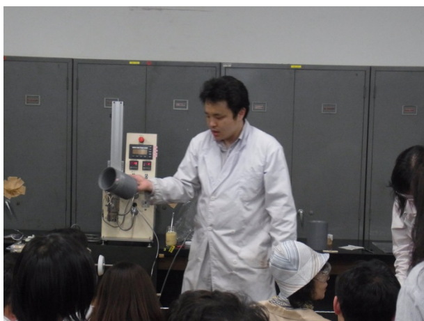
H26.05.17-18. 東京大学5月祭 研究室公開:高分子材料学研究室