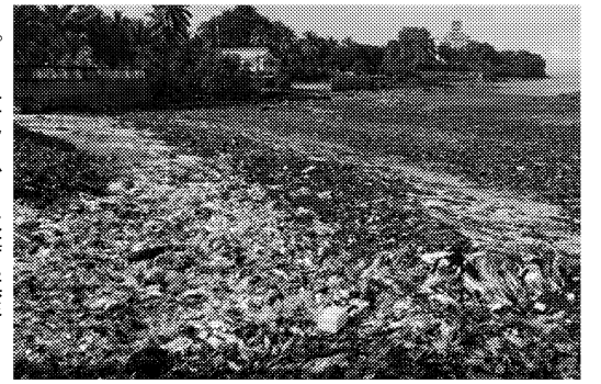
海洋汚染対策が急務